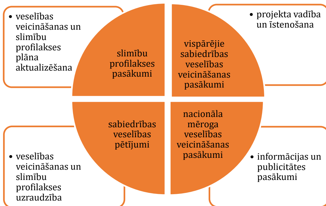
3. attēls. 9.2.4.1. pasākuma atbalstāmās darbības prioritārajās veselības jomās – sirds un asinsvadu slimības, onkoloģiskās slimības, bērnu (sākot no perinatālā un neonatālā perioda) veselība un psihiskā veselība

Pašvaldību projektos atbalstāmā darbība ir veselības veicināšanas pasākumu īstenošana un slimību profilakses pasākumu īstenošana. Savukārt Veselības ministrijas īstenotā projektā (9.2.4.1. pasākums) ietvertas šādas atbalstāmās darbības – projekta vadība un īstenošana, personāla atlīdzības nodrošināšana; veselības veicināšanas un slimību profilakses plāna izstrāde un aktualizēšana, slimību profilakses pasākumi, vispārējie sabiedrības veselības veicināšanas pasākumi, nacionālā mēroga veselības veicināšanas pasākumi mērķa grupām un vietējai sabiedrībai, sabiedrības veselības pētījumi, informācijas un publicitātes pasākumu nodrošināšana (skat. 3. attēlu).